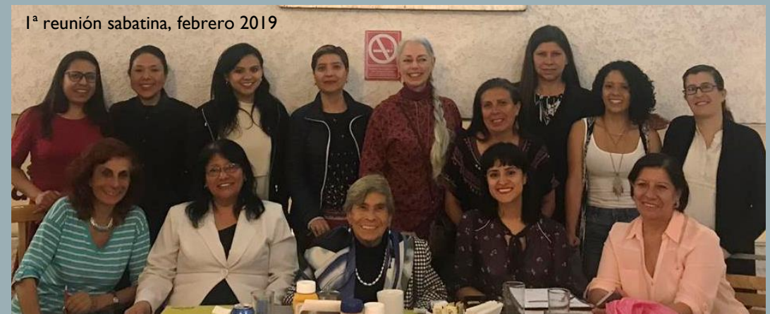
1ª reunión sabatina, febrero 2019