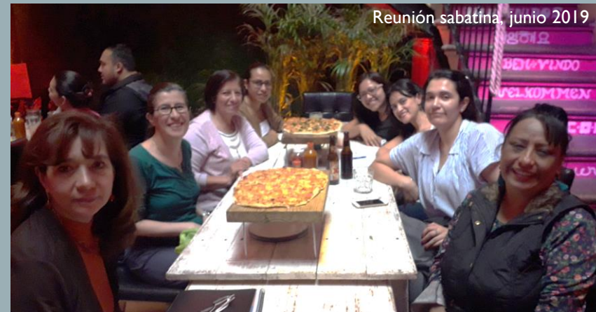
Reunión sabatina, junio 2019