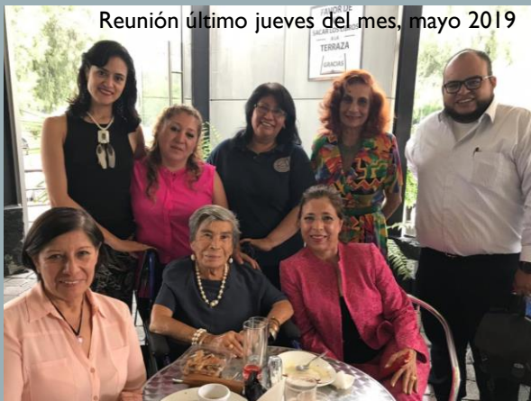
Reunión último jueves del mes, mayo 2019