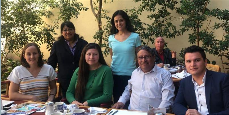
1ª reunión con nuestro actual contador, noviembre 2019