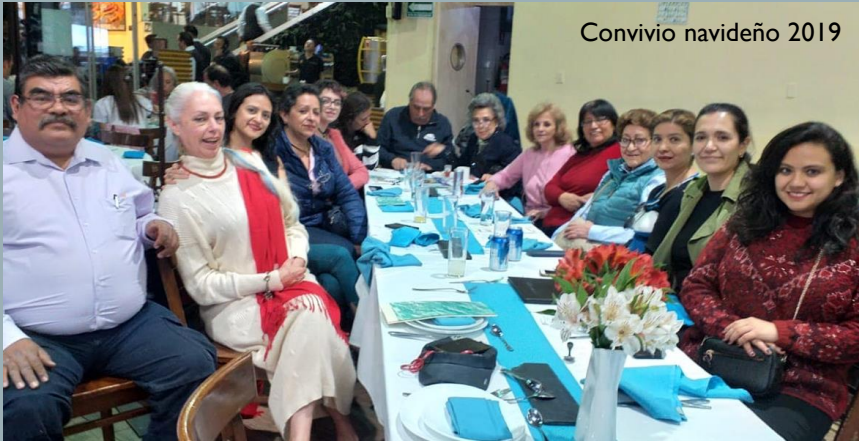
Convivio navideño 2019