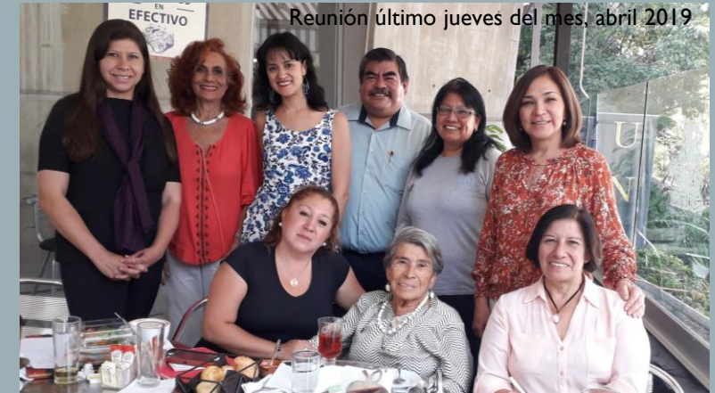
Reunión último jueves del mes, abril 2019