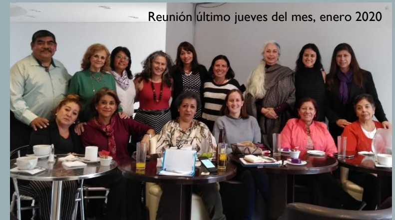
Reunión último jueves del mes, enero 2020