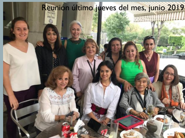
Reunión último jueves del mes, junio 2019