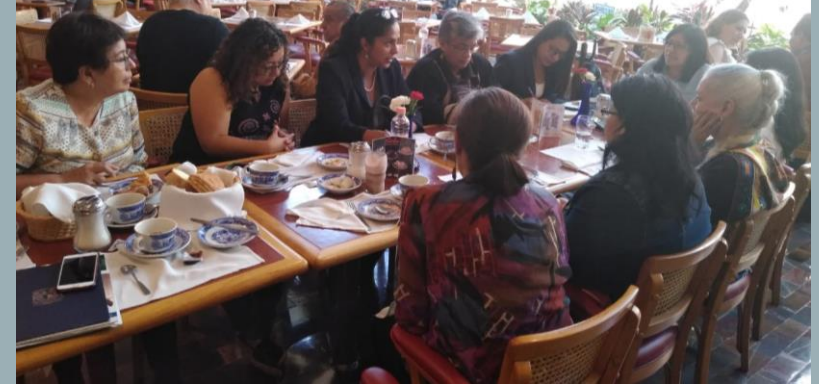
Reunión sabatina, diciembre 2019