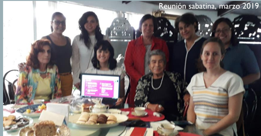
Reunión sabatina, marzo 2019