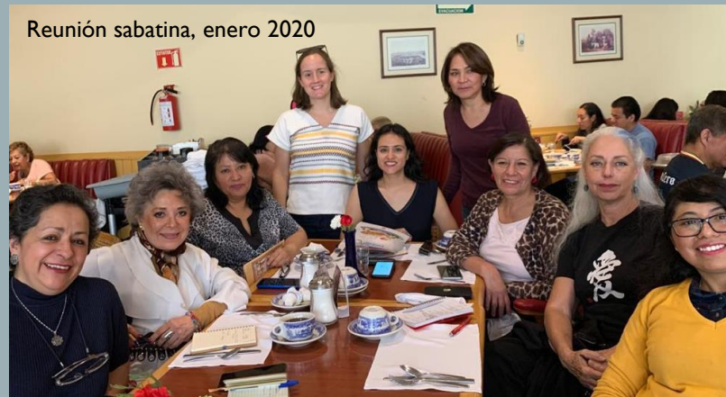
Reunión sabatina, enero 2020