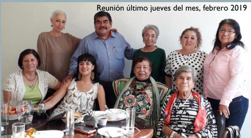
Reunión último jueves del mes, febrero 2019