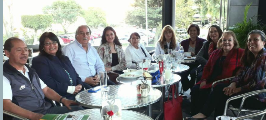
Reunión último jueves del mes, noviembre 2019